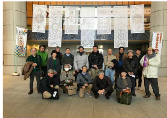
横浜市歴史博物館にて

個人的には鉄鏃が折り曲げられて、別の用途に使用されている例が紹介されていることと、毛抜形鉄製品と呼ばれるものの頭頂部の環にした鉄製