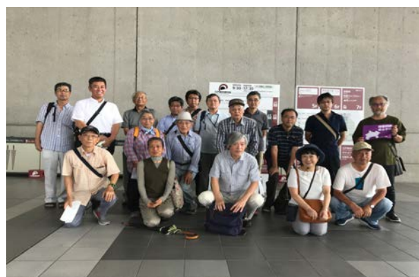
江戸東京博物館にて

会場の入り口正面には一昨年度に総括報告書が刊行され、昨年度には特別史跡に指定された加曾利貝塚の貝層標本が鎮座していた。その様は、学史的にも重要な位置にある加曾利貝塚の価値を改めて浮き彫りにしてみせているようで、印象深かった。今年度も調査が進められているとのことで、久しく赴いていないが、現地へ足を運ばねばと思わされた。同じく縄文時代の遺跡で取り上げられていた愛知県の保美貝塚もまた学史的に重要な遺跡である。一昨年度に刊行された報告書では、北陸でみられるものと